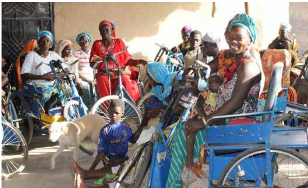
Des femmes handicapées lors d'une réunion.